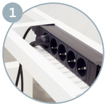
KABELKORF ONDER FRAME